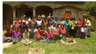
Procesos de entrega de materias primas