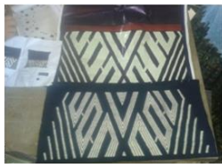
Telar de Cintura: Uso de las plantillas a escala y los renders