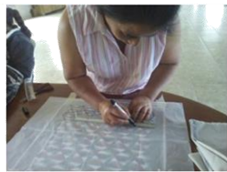
Bordado a Mano: Técnicas de calcado de diseño Sobre tela y uso de bastidores

Procesos de Capacitación y Asistencia Técnica Productiva