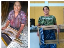
Procesos de desarrollo de nuevos diseños