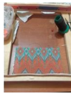
Tejido en mostacilla: Uso del telar