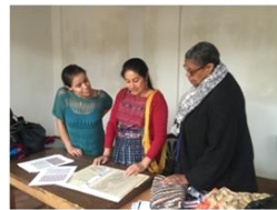
Evaluación de desarrollo de prototipos. Diseñadoras local e internacional