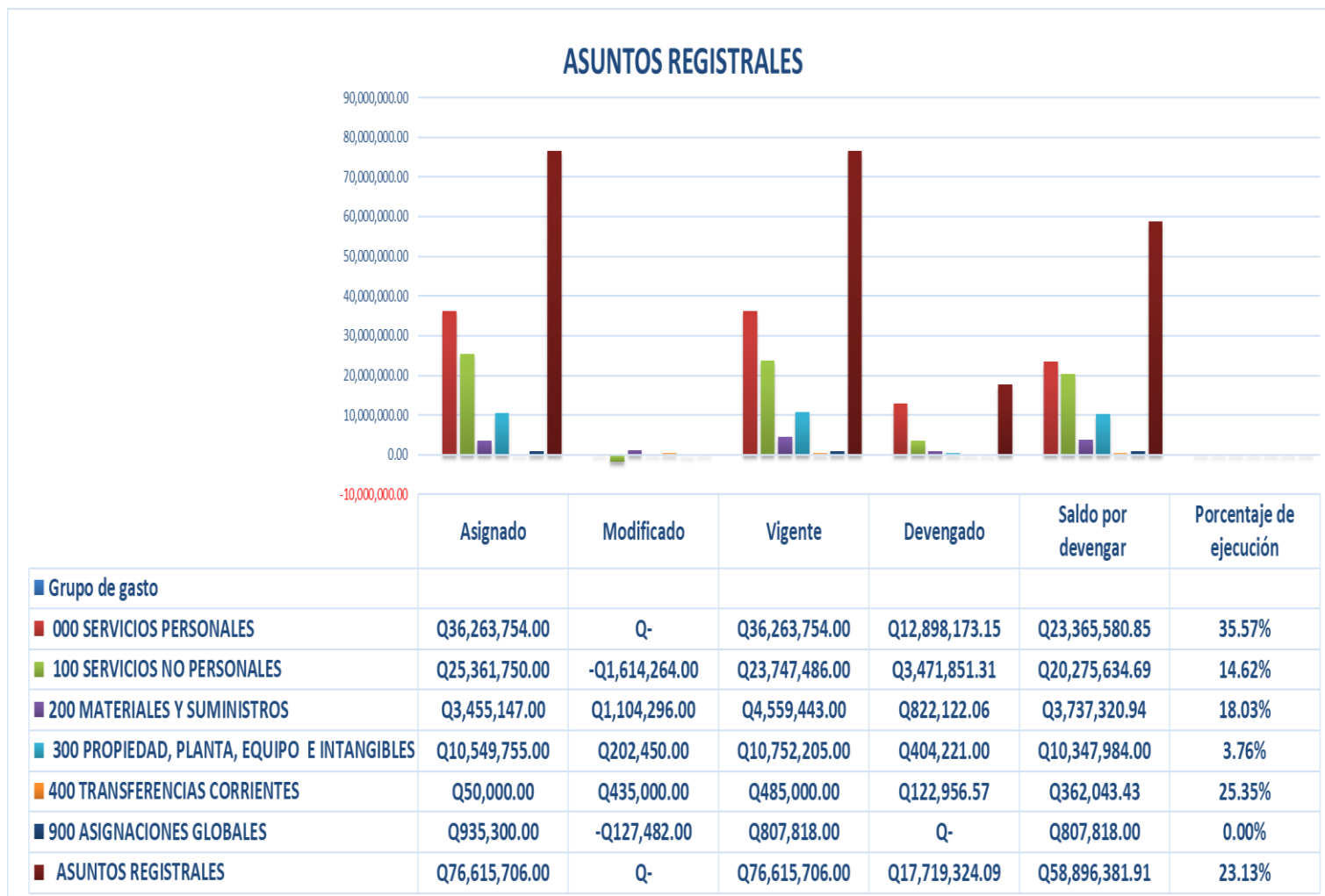
Gráfica No. 2 Viceministerio de Asuntos Registrales Ejecución Presupuestaria Al mes de abril de 2024