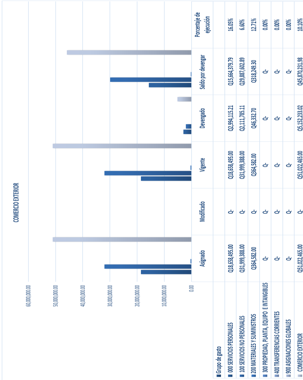
Gráfica No. 2 Ejecución Presupuestaria al mes de febrero de 2024