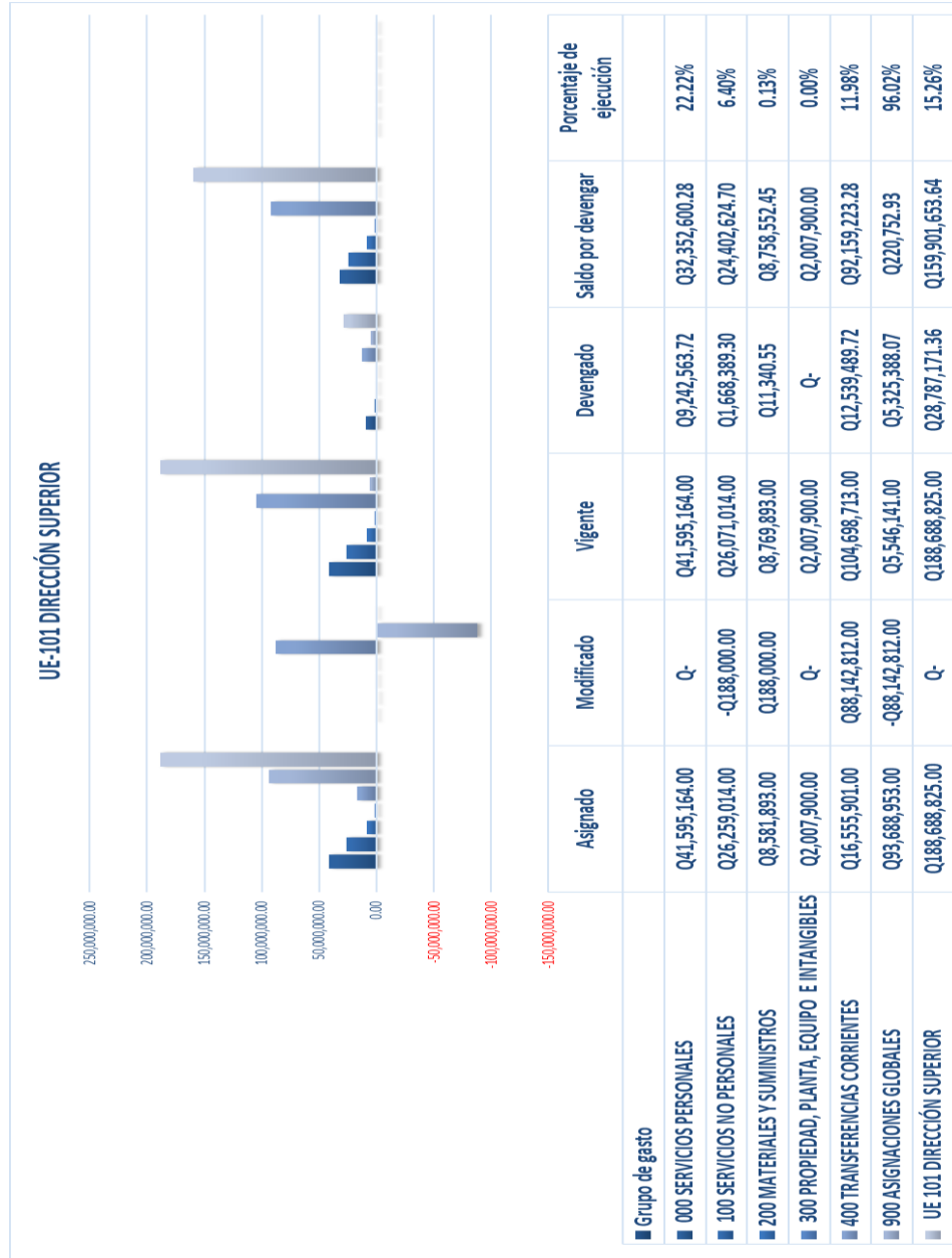
Gráfica No. 2 Ejecución Presupuestaria Al mes de marzo de 2024