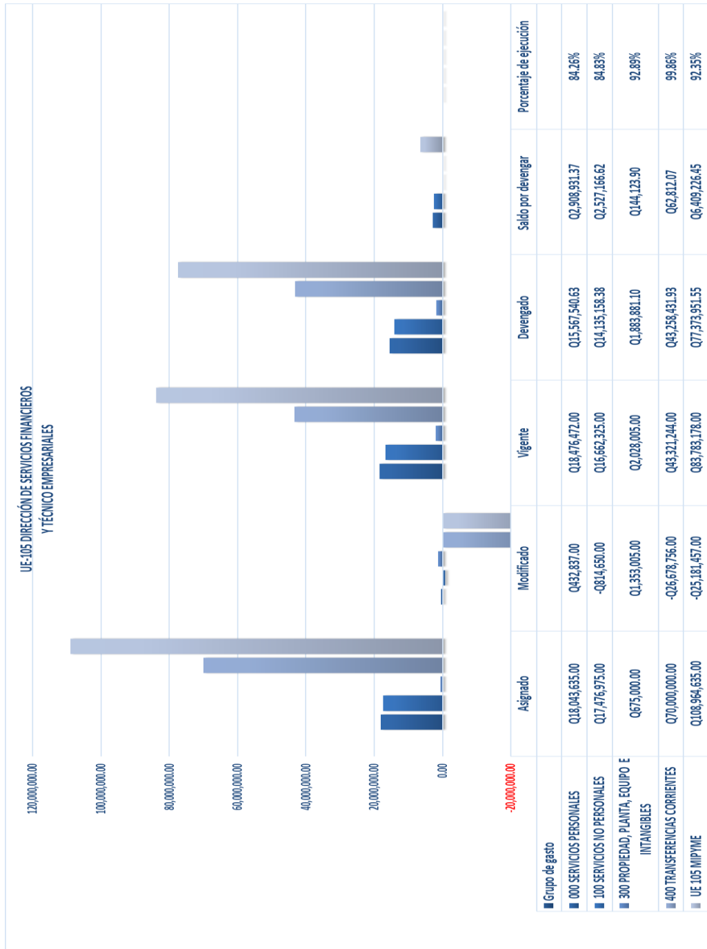
Gráfica No. 1 Ejecución Presupuestaria Al mes de noviembre de 2023